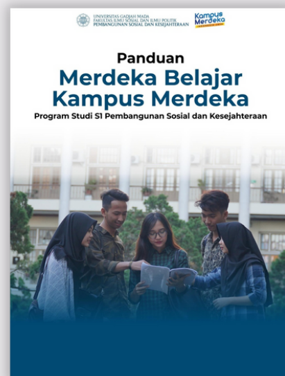
Buku Panduan MBKM-Prodi PSdK