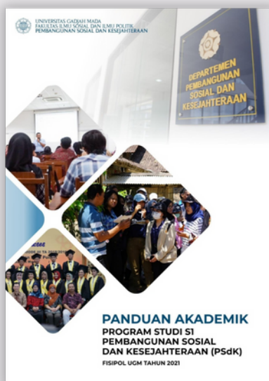
Buku Panduan Akademik PSdK

Penyusunan buku ini mengacu pada berbagai buku panduan MBKM dari Kemendikbud, universitas, fakultas, dan program studi. Untuk informasi lebih detail dari setiap program yang ada, sobat PSdK dapat mengacu dan mengakses Buku Panduan Akademik dan Buku Panduan MBKM Prodi PSdK di link berikut ini.